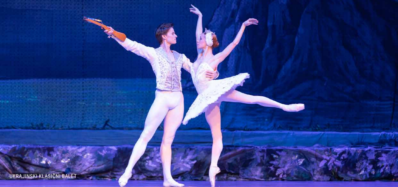
UKRAJINSKI KLASIČNI BALET