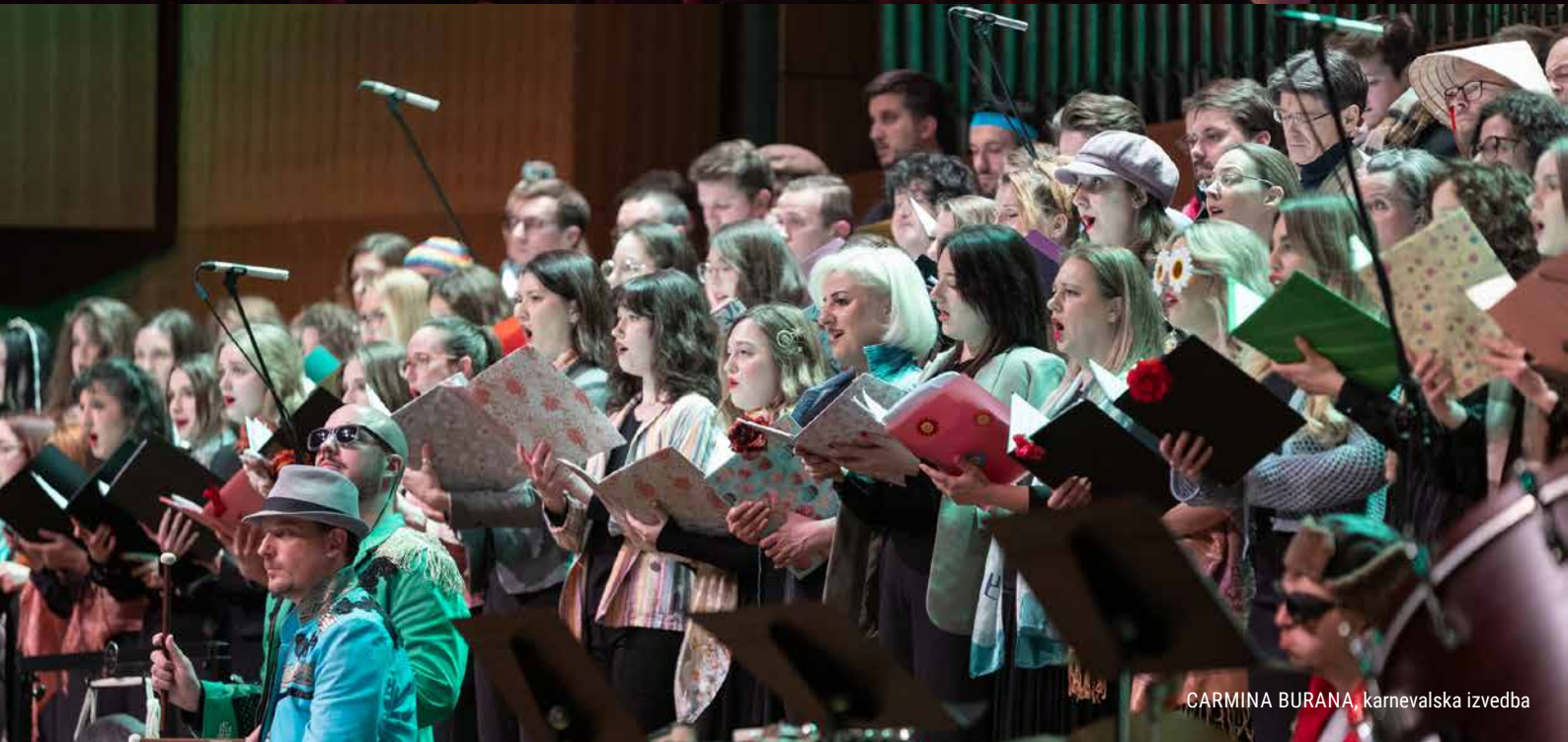
CARMINA BURANA, karnevalska izvedba