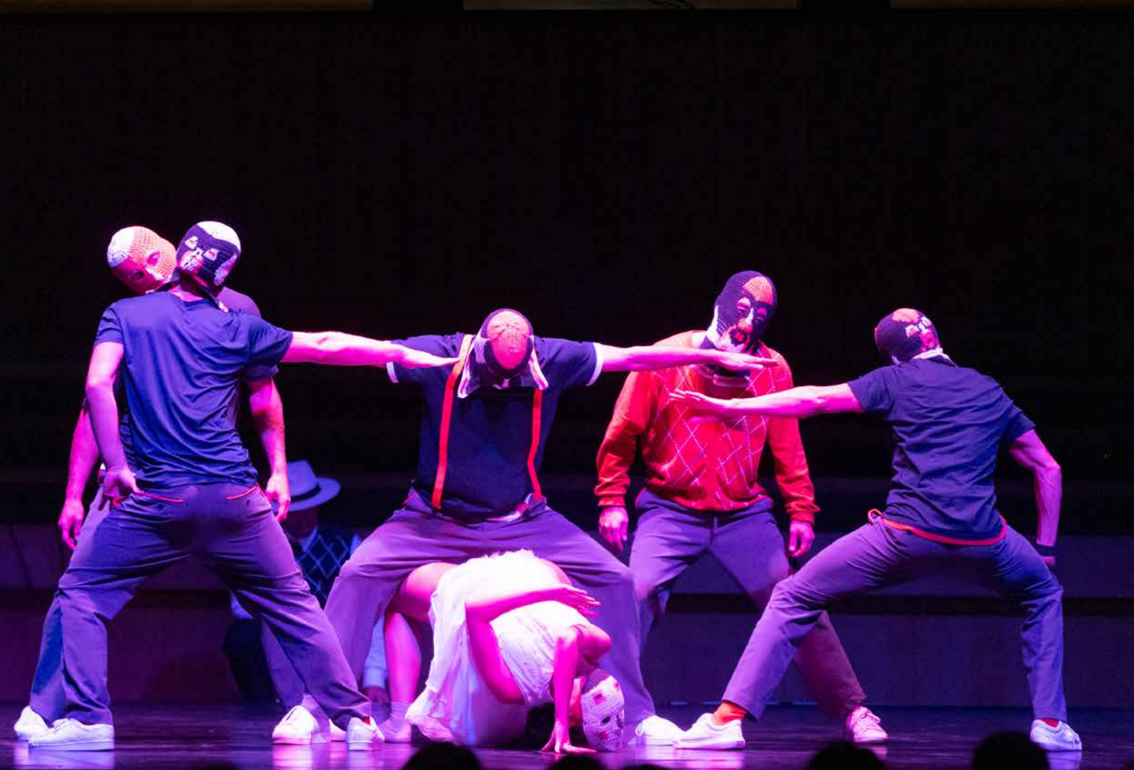
FLYING STEPS – FLYING BACH