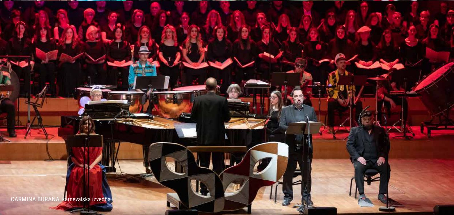
CARMINA BURANA, karnevalska izvedba