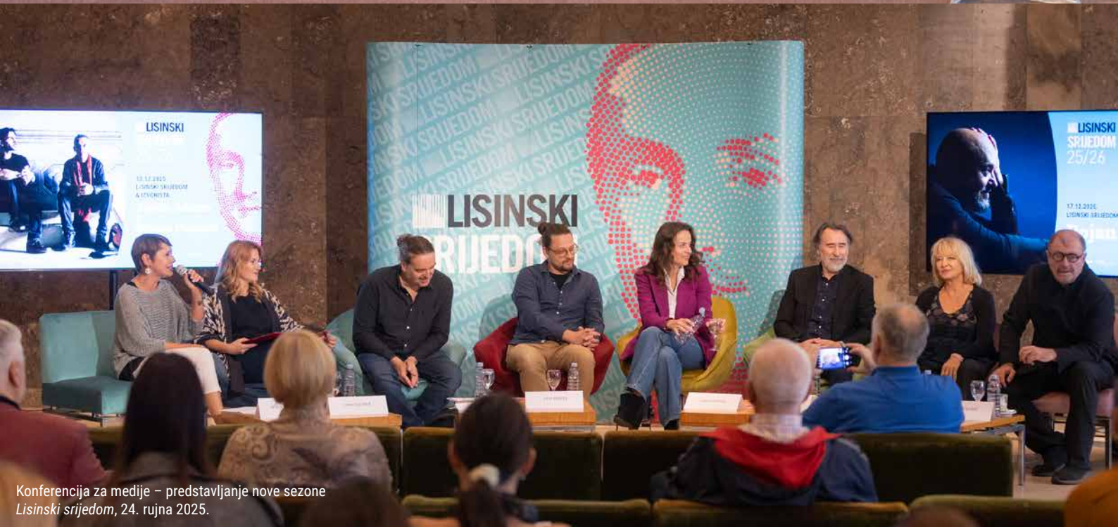
Konferencija za medije – predstavljanje nove sezone Lisinski srijedom, 24. rujna 2025.