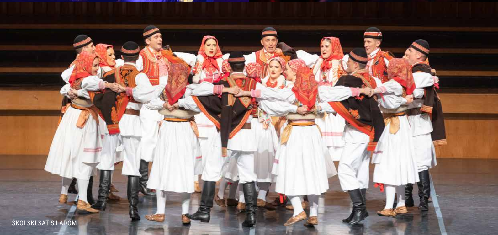
ŠKOLSKI SAT S LADOM