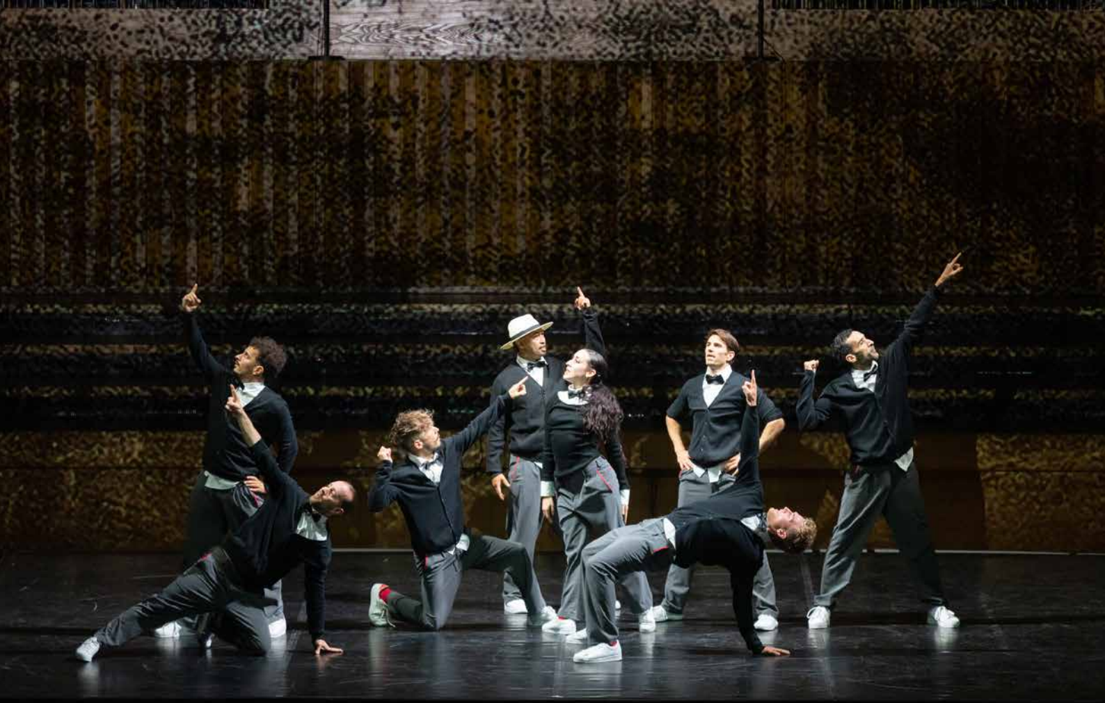
FLYING STEPS – FLYING BACH