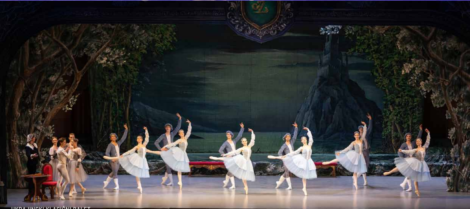
UKRAJINSKI KLASIČNI BALET