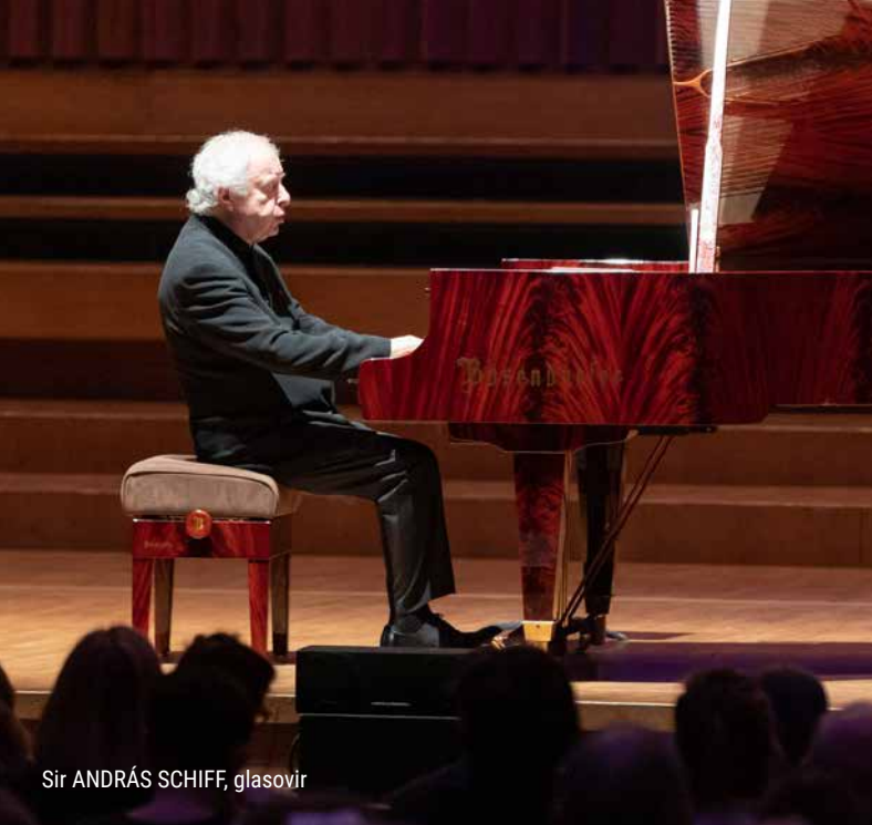
Sir ANDRÁS SCHIFF, glasovir