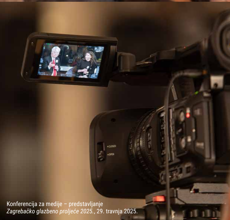
Konferencija za medije – predstavljanje Zagrebačko glazbeno proljeće 2025., 29. travnja 2025.