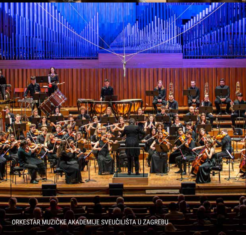
ORKESTAR MUZIČKE AKADEMIJE SVEUČILIŠTA U ZAGREBU