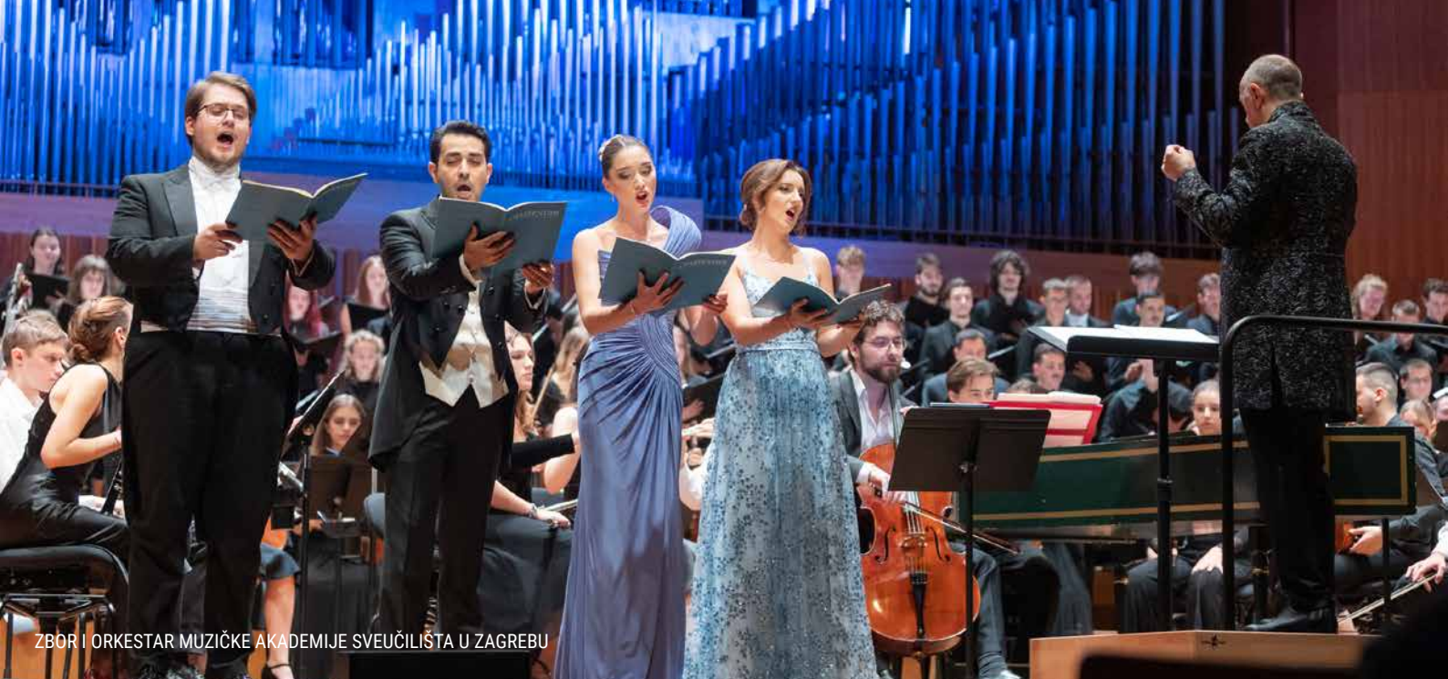
ZBOR I ORKESTAR MUZIČKE AKADEMIJE SVEUČILIŠTA U ZAGREBU