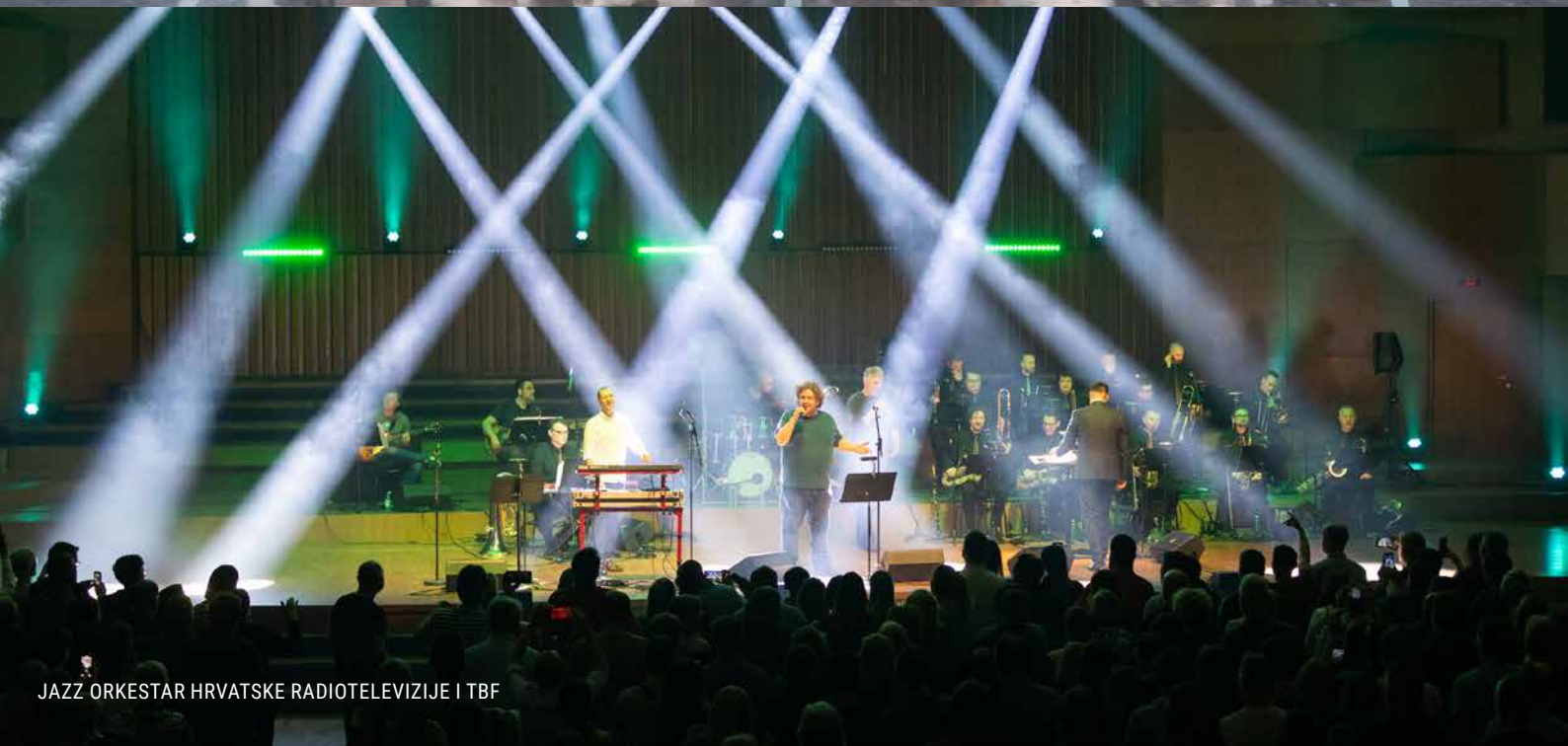
JAZZ ORKESTAR HRVATSKE RADIOTELEVIZIJE I TBF