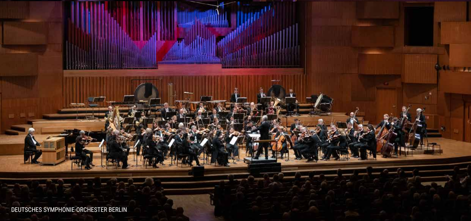
DEUTSCHES SYMPHONIE-ORCHESTER BERLIN