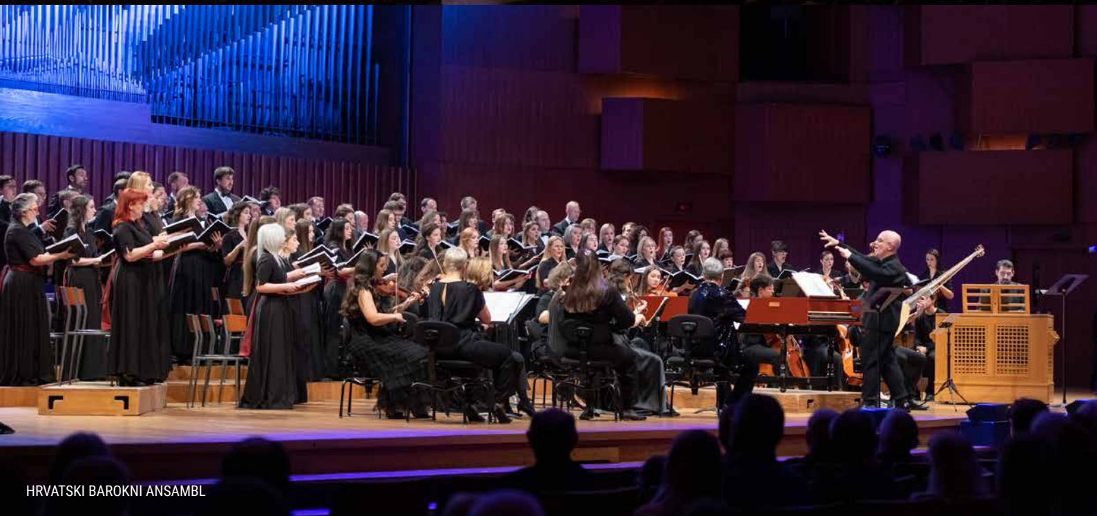
HRVATSKI BAROKNI ANSAMBL