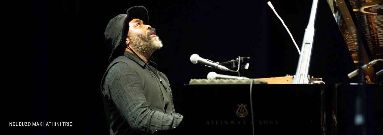
NDUDUZO MAKHATHINI TRIO