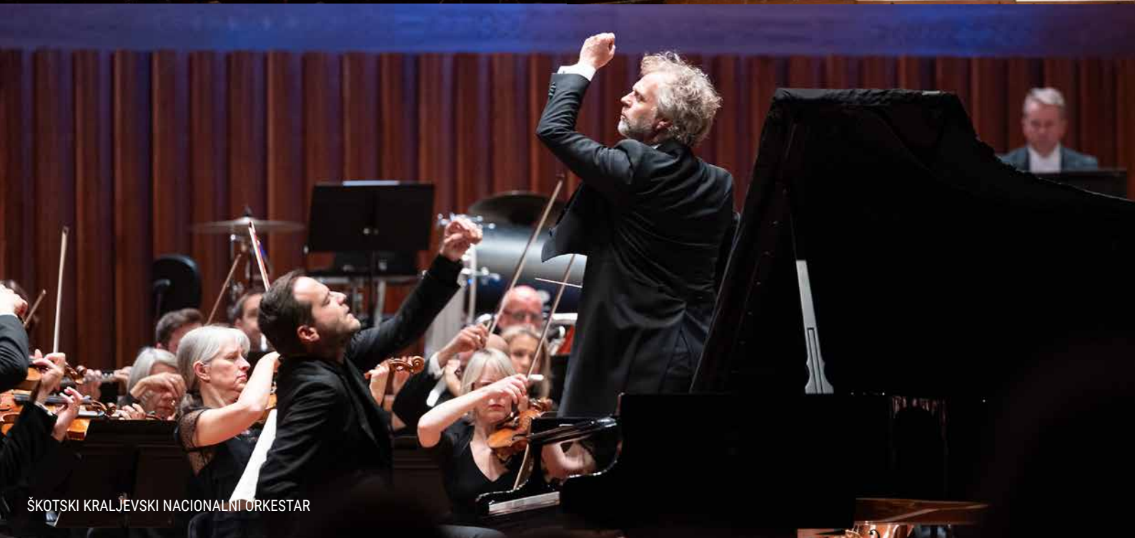
ŠKOTSKI KRALJEVSKI NACIONALNI ORKESTAR