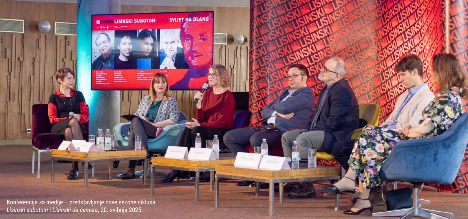
Konferencija za medije – predstavljanje nove sezone ciklusa Lisinski subotom i Lisinski da camera, 20. svibnja 2025.