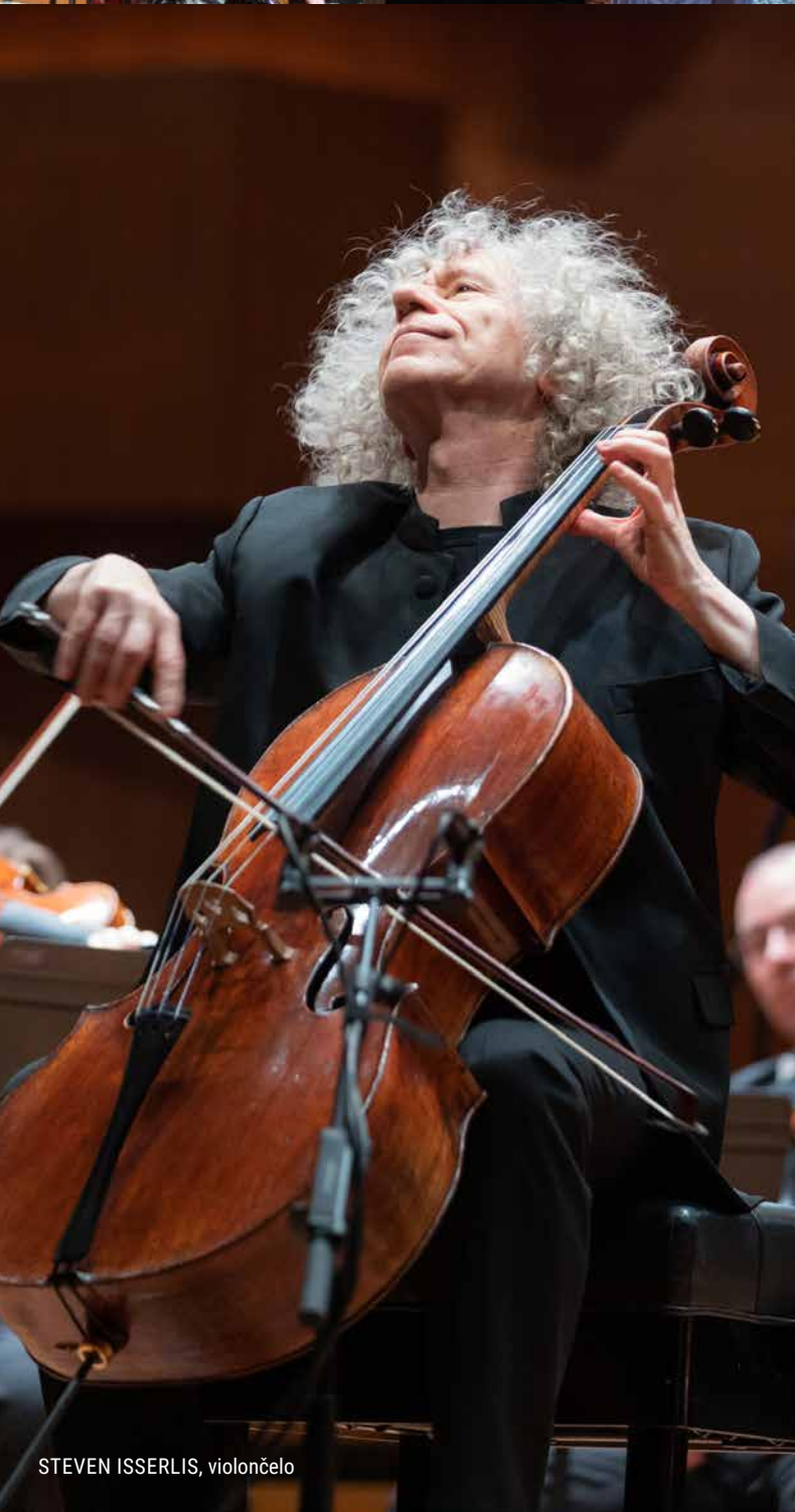
STEVEN ISSERLIS, violončelo