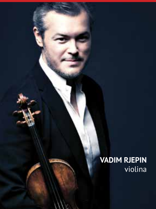
VADIM RJEPIŃ violina